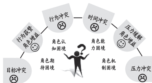
图2 产教融合背景下教师角色困顿图